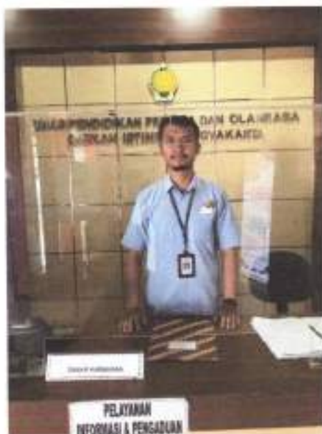
Gambar 1. Foto front desk layanan informasi publik.