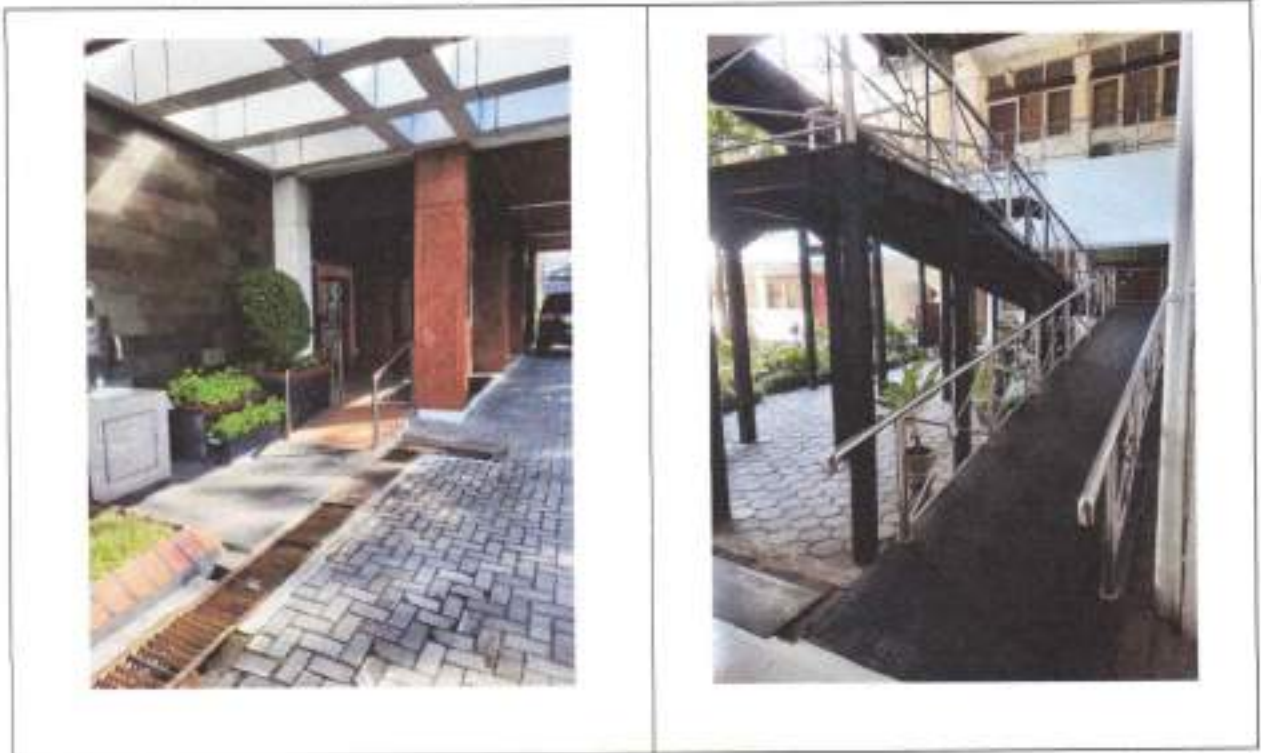
Gambar 3 ram rambatan dan akses kursi roda