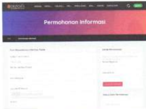
Gambar 6 Foto widget untuk permohonan informasi