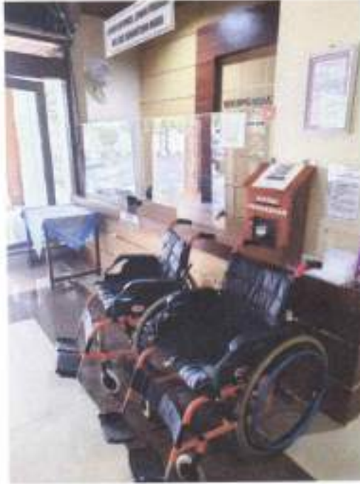
Gambar 2 Foto front desk layanan informasi publik dengan fasilitas kursi roda